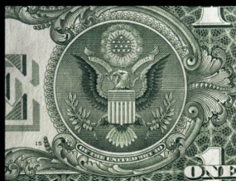
Dollaro geneticamente modificato, 2005©