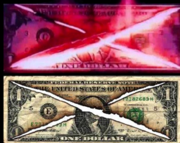
Odorale è Buono, 2000

Il volto di George si dissolve rivelando continenti