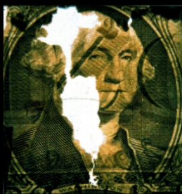
Immagine di Dollaro, 1989

Il volto di George si dissolve rivelando continenti